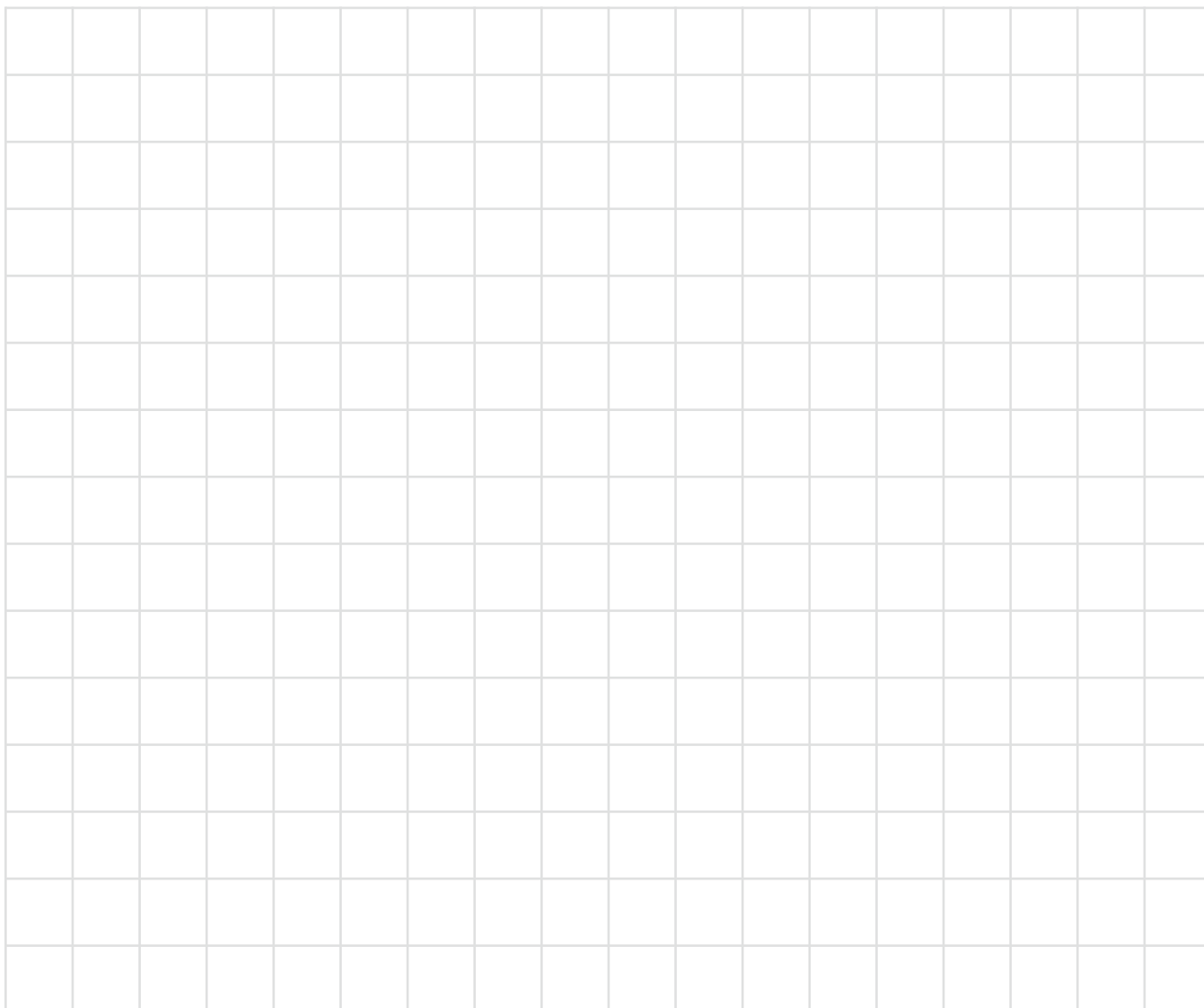
SCHÉMA COMPLÉMENTAIRE (croquis en plan et en coupe et mur d'appuie si existant)